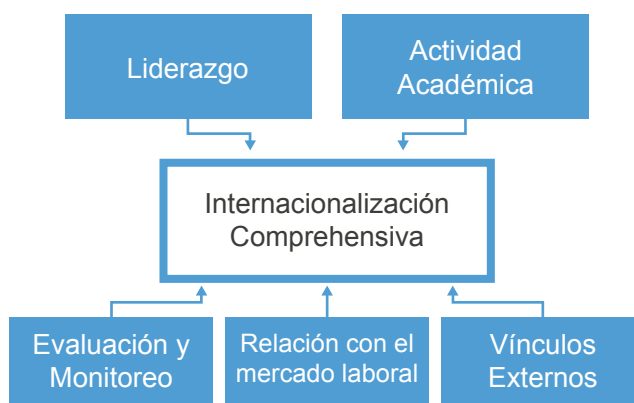
Figura 1. Mapa conceptual Internacionalización Comprehensiva

Existen numerosos motivos para internacionalizar la