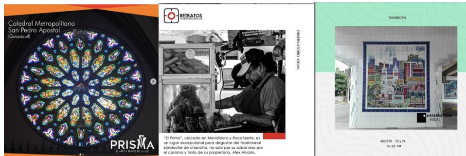
Figura 3. Exposición Vitrales(izq), Retratos gastronómicos (centro) y murales (der).

El eje urbano se planifica con el tutor y los estudiantes mediante un 1 mes de investigación bibliográfica y 1 mes para salidas de campo donde se registra videos, entrevistas y fotografías que serán empleados como recursos expositivos. Finalmente pasan por un proceso de selección por parte del tutor y evaluadores invitados. En este eje es importante resaltar que la experimentación de reproducción sobre soportes poco explorados en los museos es un valor diferenciador un ejemplo la aplicación de realidad aumentada (2 meses). Figura 2