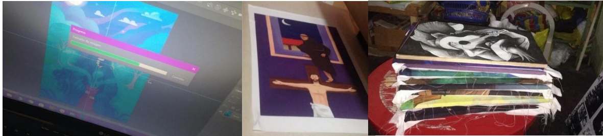
Figura 2. Proceso avance(izq), prueba de color (centro) y montaje en bastidores (der).

comunicación activa donde se solicita a cada artista un envío semanal fotográfico del avance. Al cumplirse los 2 meses, el grupo de montaje con el apoyo de gerencia administrativa de Espol retiran las obras y se resguardan en el club de UGA. Figura 2