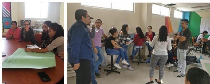
Figura1. Mesas de trabajo de proceso individual(izq) y grupal(der).

La modalidad de las mesas se dio inicialmente de manera individual, en horarios distintos para cada grupo donde participaban el docente tutor, el líder de cada grupo con sus integrantes, donde se presentaba un problema general. En estas mesas se desarrollaron lluvias de ideas en pliegos de cartulinas, de esta manera cada equipo al ingresar al salón de trabajo notaba lo plasmado por los otros equipos en base a las sugerencias e inquietudes sobre la conservación cultural de alguna zona. La riqueza de este trabajo colaborativo permitía que estudiantes de otros grupos pudieran generar retroalimentación con notas adhesivas. Es importante resaltar que los grupos iniciales se crearon por orden de apellidos, coordinados por parte del docente tutor, en la siguiente fase los estudiantes elegían el tema de mayor interés para trabajarlo durante el semestre. Figura1