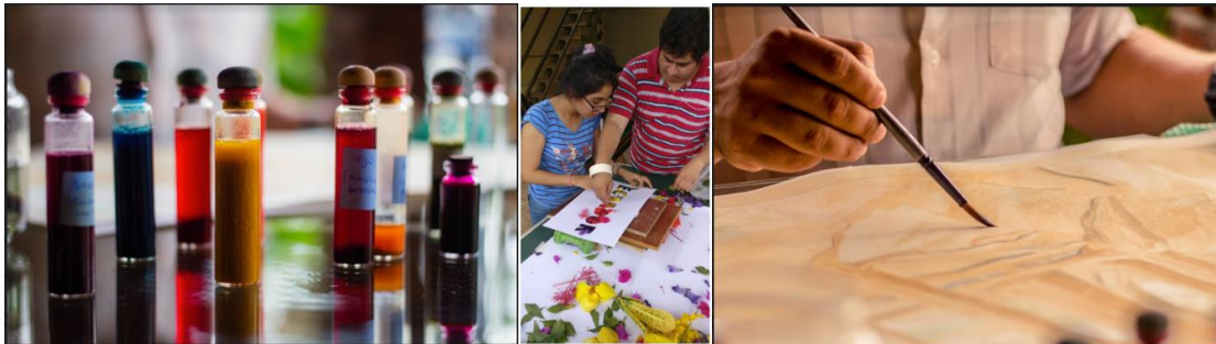
Figura 5. Proceso avance(izq), prueba de color (centro) y montaje en bastidores (der).

En la segunda parte de este eje se presentaba la experimentación de los estudiantes, desarrollando nuevos procesos que serían aplicados en obras por parte de artistas invitados. En este eje los tiempos planificados son de 3 meses. Figura 4