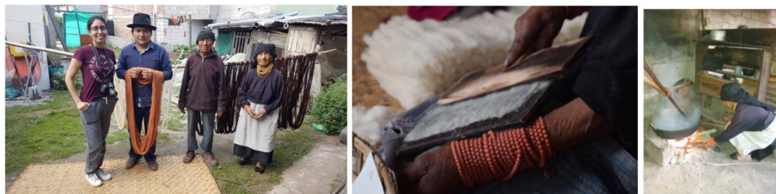
Figura 4. Visita de campo (izq), curso (centro) y proceso (der).

En el eje patrimonio cultural se planificaron visitas de campo donde estudiantes registran los procesos de manera fotográfica y audiovisual. Se desarrollaban entrevistas y el grupo de estudiantes y tutor aprenden la técnica.